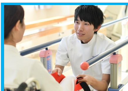
リハビリテーション学科 理学療法学専攻