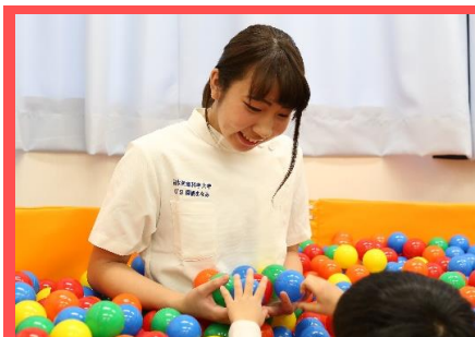
リハビリテーション学科 作業療法学専攻